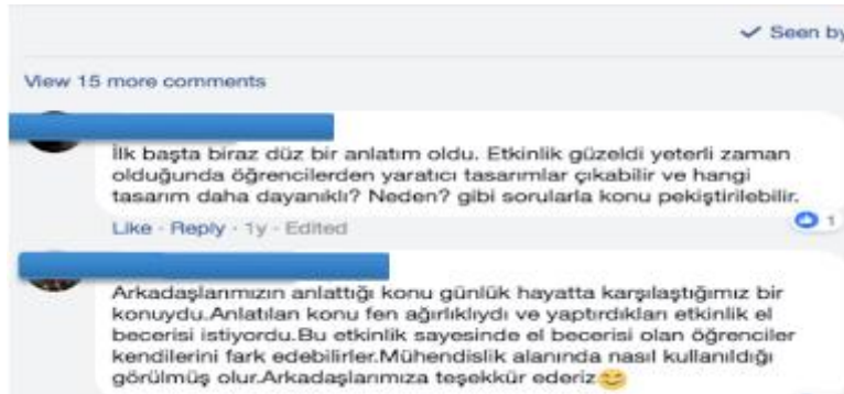
Şekil 3. Katılımcıların Facebook grubunda yaptıkları değerlendirmelerden bir kesit

Deneme öğretimler sonunda öğretmen adayları ders kapsamında oluşturulan Facebook grubunda arkadaşları tarafından oluşturulan öğrenme ortamlarının FeTeMM yaklaşımına uygunluğunu tartışmışlardır. Facebook grubunda öğretmen adaylarının yaptıkları değerlendirmelere ve tartışmalara yönelik bir kesit Şekil 3’te gösterilmiştir.