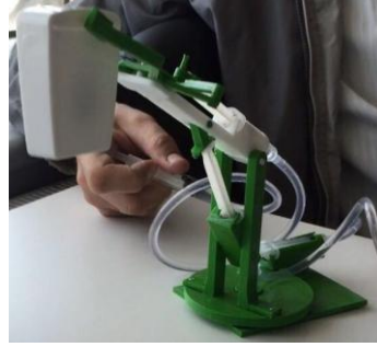
Şekil 2. 3-boyutlu yazıcıda üretilen kepçe

İlk üç hafta FeTeMM yaklaşımı hakkında bilgiler verilmiş ve yine bu süreçte öğretmen adaylarıyla FeTeMM yaklaşımını temele alan ulusal makale ve raporlar incelenerek değerlendirmeler yapılmıştır. Dersin dördüncü haftasında bu yaklaşımın uygulama alanlarının ve 3-boyutlu yazıcıların anlaşılması adına üniversite bünyesinde bulunan laboratuvarlara geziler düzenlenmiştir. Ders sonunda öğretmen adayları tarafından hazırlanan örnek bir kepçe modeli Şekil 2’de görüleceği gibi 3-boyutlu yazıcı ile tekrar üretilmiştir.